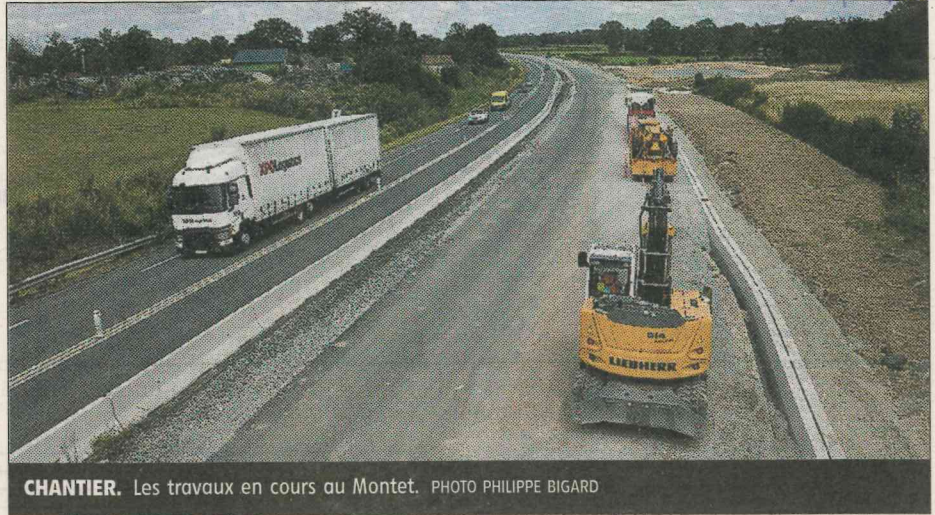
CHANTIER. Les travaux en cours au Montet.

Depuis le diffuseur de Molinet, suivre RD 994, RD 779, RN 2079, RD 979