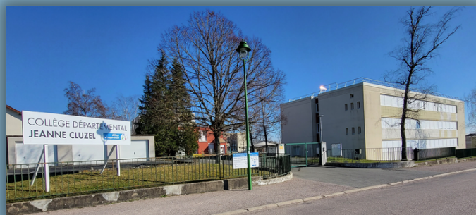
Collège Jeanne Cluzel