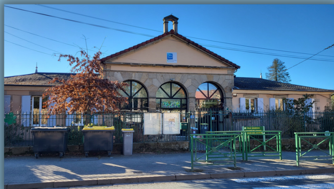
Centre de loisirs "La Fourmilière"