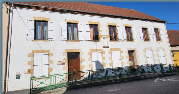
Ecole Privée Maternelle et Élémentaire Sainte-Thérèse