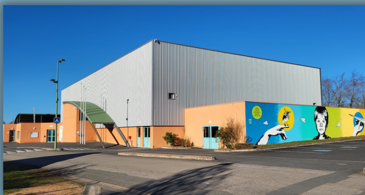
Halle des Sports Maurice DELFOUR

Infos Municipales Travaux Vie Municipale Vie Locale Manifestations Associations Agenda 2023