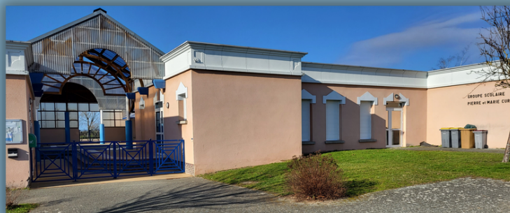
Ecole Primaire Pierre et Marie Curie