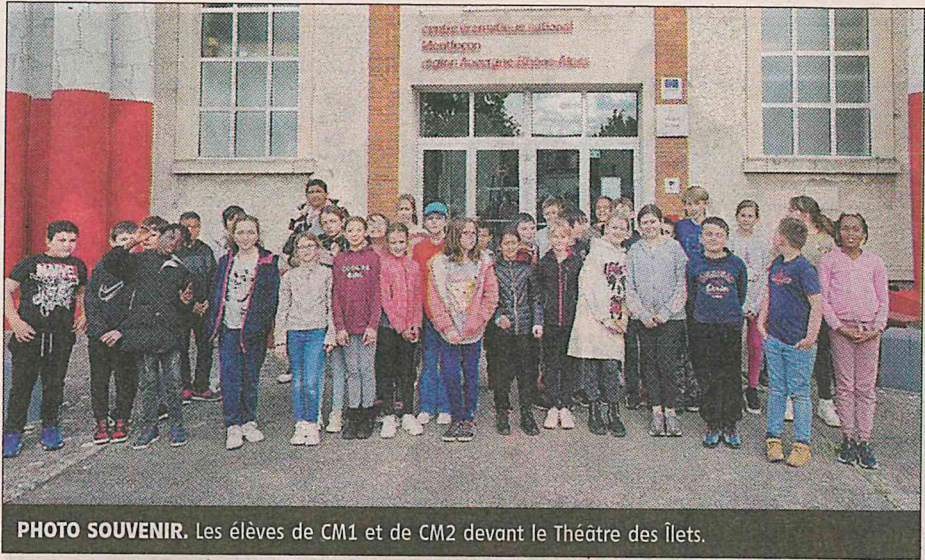
PHOTO SOUVENIR. Les élèves de CM1 et de CM2 devant le Théâtre des Îlets.