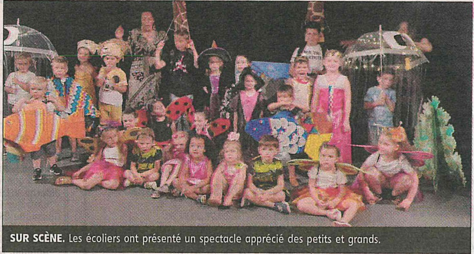
SUR SCÈNE. Les écoliers ont présenté un spectacle apprécié des petits et grands.