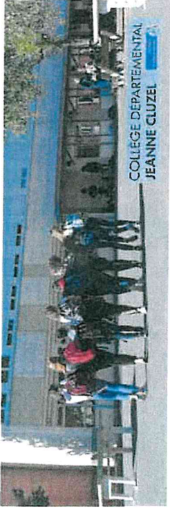
COLLÈGE DÉPARTEMENTAL JEANNE CLUZEL